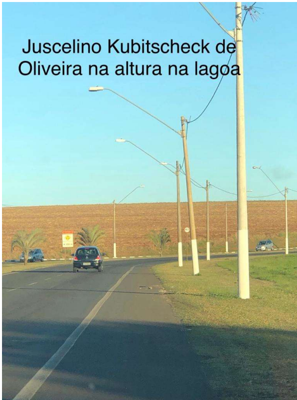
Juscelino Kubitschek de Oliveira na altura na lagoa