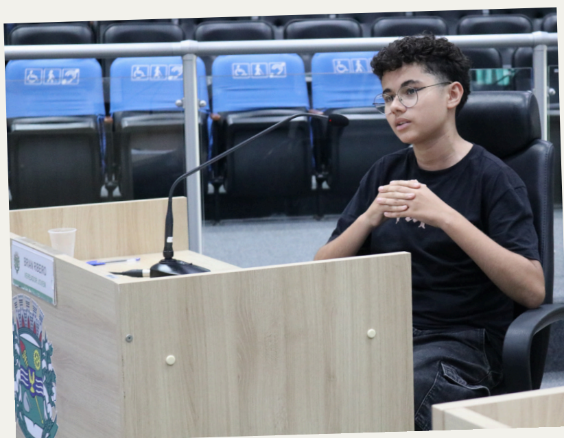
Novembro 2ª Sessão Ordinária