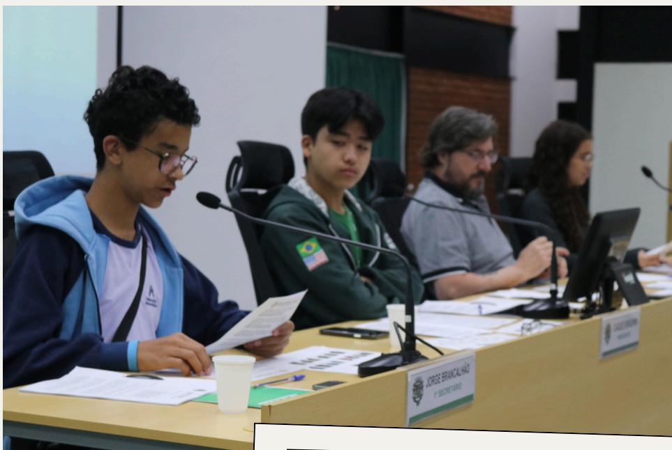
Setembro 1ª Sessão Ordinária